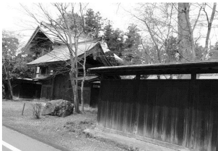
薬医門と黒べいの民家