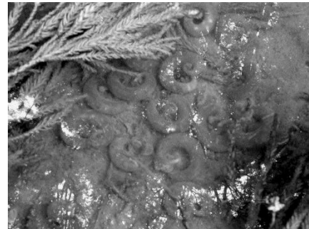
トウキョウサンショウウオの卵